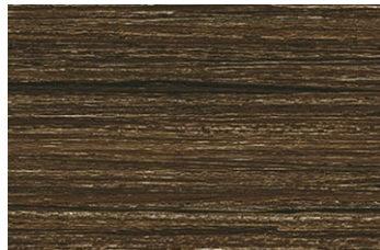
AN-2568KM 木目調/ヨコ柾目 ポリ