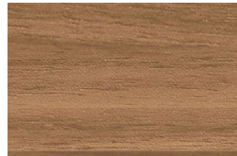
ANY 2666KM ウォールナット/ヨコ追柾