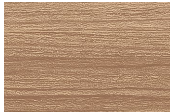
ANY 2679KM チーク/ヨコ柾目 ● TJY 2679K