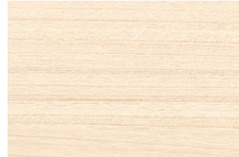
ANY 2681KM チェリー/ヨコ柾目 ● TNY 2681K