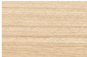
ANY 2682KM チェリー/ヨコ柾目 ポリ