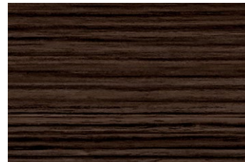
AN-2665KM エボニー/ヨコ柾目 ■ AN-720KM