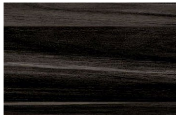
AN-2597KM レッドウッド/ヨコ追柾 ポリ