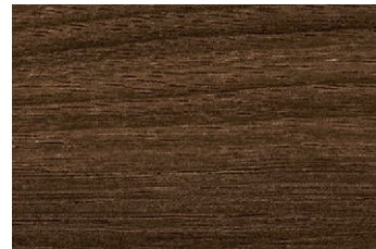
AN-10006KM ウォールナット/ヨコプラント ● TJ-10006K ■ AN-10005KM