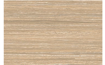
AN-2580KM 木目調/ヨコ柾目 ポリ