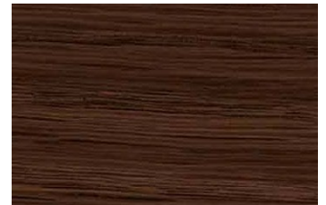
AN-2255KM オーク/ヨコ柾目 ● TJ-2255K