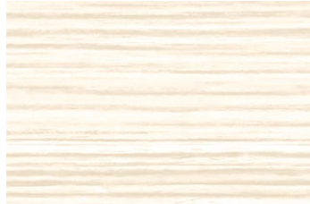
LN-2664KM エボニー/ヨコ柾目 ■ LN-1940KM