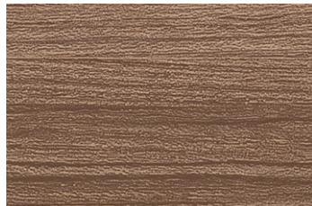
AN-2680KM チーク/ヨコ柾目 ● TJ-2680K