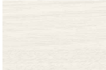
ANY 2260KM ウォールナット/ヨコ柾目